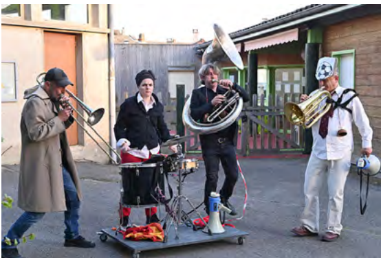
Déambulation, théâtre de rue 1h, dès 11 ans

Dim. 28 septembre à 15h30 • Annonay, Place de la Liberté