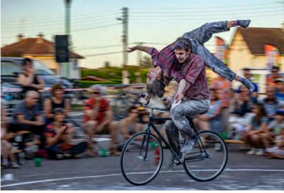
Duo sur vélo acrobatique 45 min, tout public