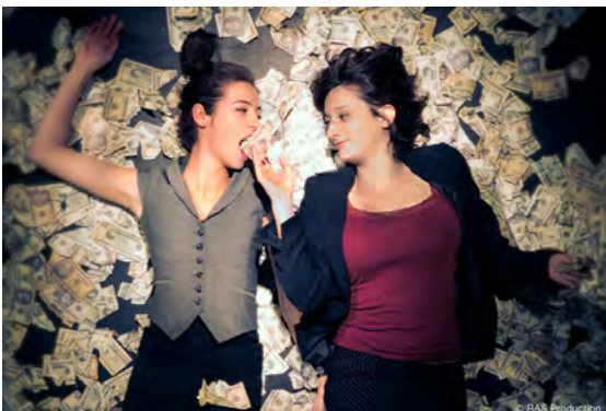
Théâtre 1h15, dès 12 ans