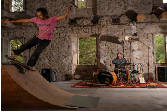
Théâtre, danse, cirque, musique et Skateboarding 45 min, tout public